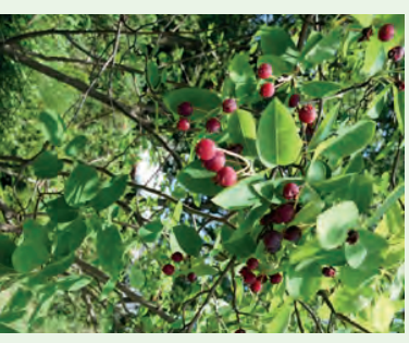
Felsenbirne Amelanchier ovalis