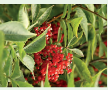
Roter Holunder Sambucus racemosa