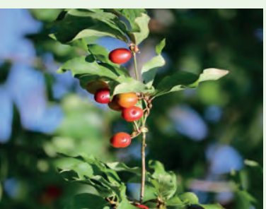
Tierlbaum Cornus mas