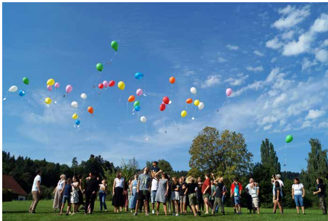
Bunte Ballone starten zu ihren Taten