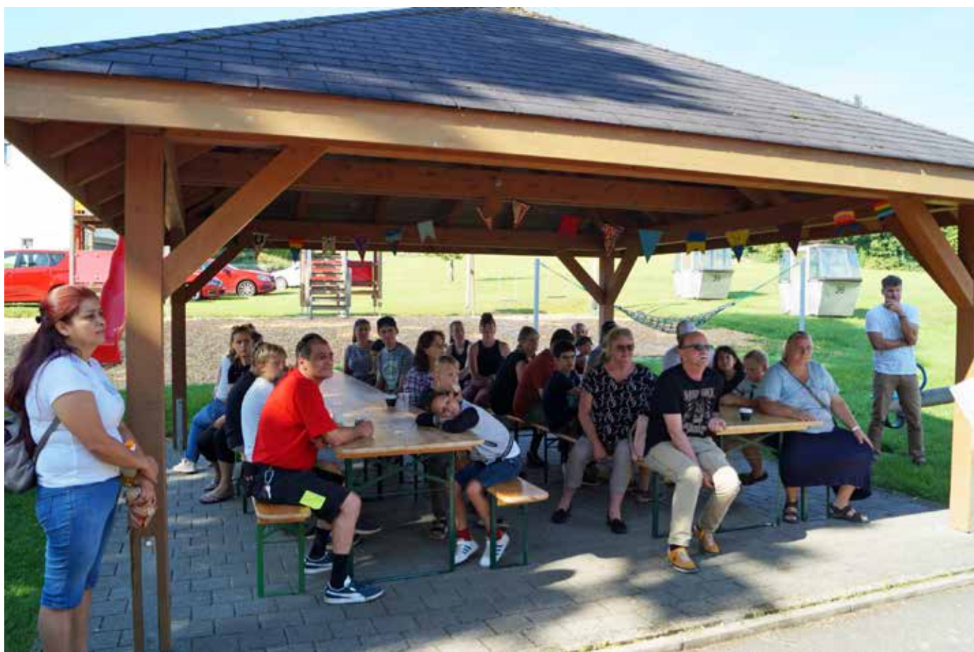
Alle sind wieder da