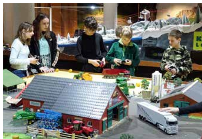
Konzentration im Modellspielland

Dank der guten Planung und Organisation des Winterlagers, so wie die tägliche Zubereitung unseres leckeren Essens durch unser Küchenteam, der guten Zusammenarbeit von Gross und Klein, aber auch dem nicht ganz winterlichen Ambiente, bleibt dieses Winterlager unter dem Motto «No Drama Lama» allen in guter Erinnerung.