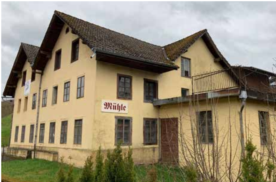
Die Mühle in Walde