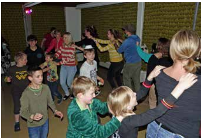
Disco für Gross und Klein