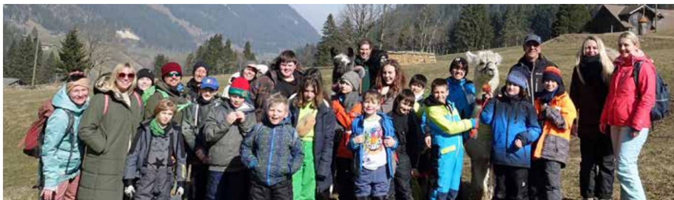
No Drama Lama

erwarten konnten, den Funpark weiter zu erkunden. Den letzten Lagerabend rundeten wir mit einer Disco ab. Die Kinder stylten sich und waren sichtlich aufgeregt auf das bevorstehende Programm. Mit einem Live-DJ, Liederwünschen von den Kindern und Erwachsenen, einer Tombola, Spielen, einer Lichtershow, Drinks und Snacks wurde es ein sehr gelungener Abend. Wir tanzten, sangen und grölten alle zusammen auf der Tanzfläche. Bei der Fotoecke konnte man lustige Fotos mit Lama-Masken schießen und bei der Verlosung bei der Tombola tolle Preise gewinnen. Wir tanzten bis spät am Abend, so dass alle Kinder zufrieden zu Bett gehen konnten.