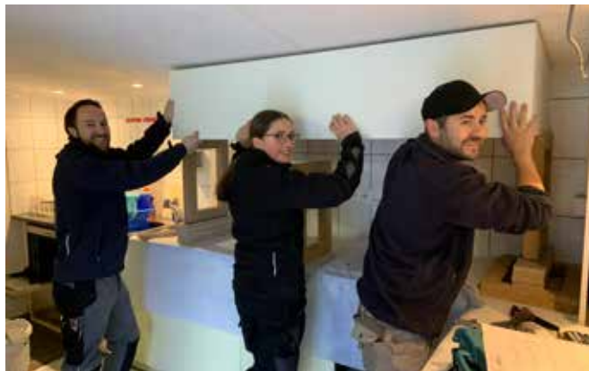
Die neue Dunstabzugshaube im Badi-Restaurant

Wir freuen uns auch dieses Jahr auf unsere Schüler und Schülerinnen von Schmiedrued und Schlossrued.