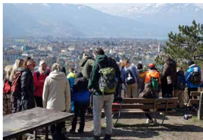
Fernsicht über Interlaken