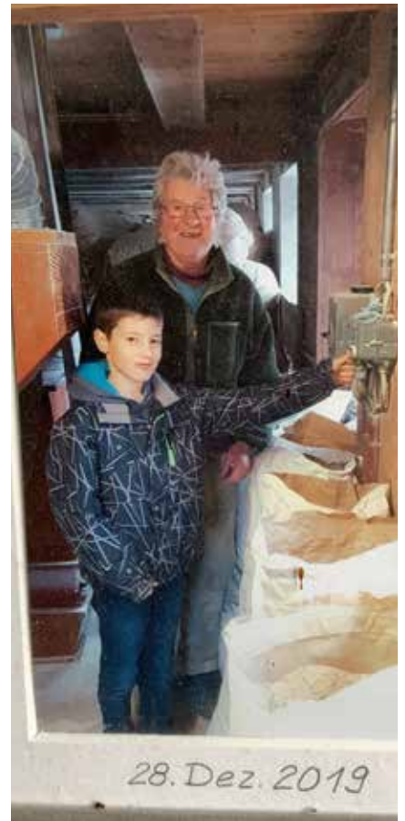
Die Mühle wird abgeschaltet

IV erhalten. Der Grund damals: Ich würde ja weiterhin arbeiten. Doch ich habe das Schicksal angenommen und, so denke ich, ganz gut gemeistert.