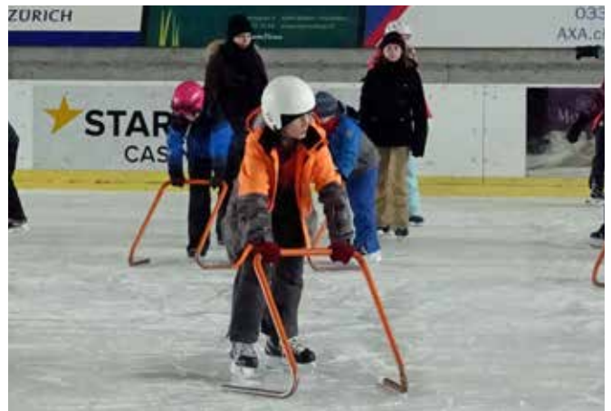
Action auf dem Glatteis