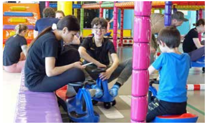
Im Funpark unterwegs

Am zweiten Lagertag machten wir uns nach dem Frühstück direkt auf den Weg nach Interlaken. Dort besuchten wir einen Wildtierpark, welcher zu unserer Überraschung kleiner war als gedacht. In einem Gehege konnten wir einige Steinböcke beobachten. Da der Aufenthalt kürzer war als geplant, entschieden wir uns, eine kleine Wanderung durch den Wald zu unternehmen, in der die Kinder die Wegrichtung vorgaben. Hier konnten wir die tolle Aussicht über Interlaken geniessen und Gleitschirme am Himmel beobachten. Gemeinsam machten wir Rast auf verschiedenen Bänken und assen unseren Lunch. Danach fuhren wir ins Zentrum von Interlaken, wo wir uns in Gruppen aufteilten, um