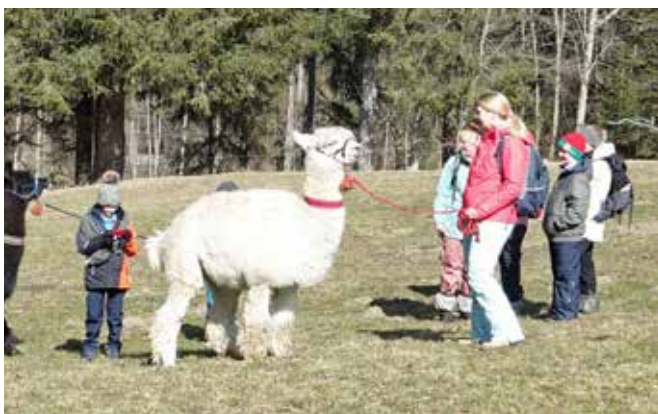
Mit den Lamas unterwegs

flanieren zu gehen. Jedes Kind konnte sich von seinem Sackgeld etwas kaufen. Am Abend kamen die Kinder noch in den Genuss von viel Freizeit.