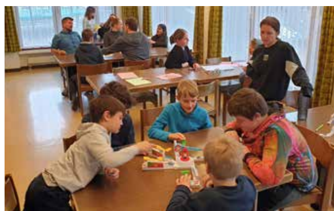
Spiel und Spass im Lagerhaus