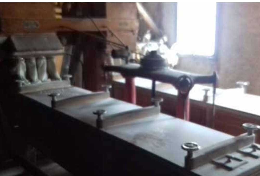
Die alte Mühle läuft jetzt in Rheinfelden

Den 11. Mai 1967 vergesse ich nicht: An diesem Tag hatte ich einen schweren Traktorunfall. In der Folge musste mein linkes Bein oberhalb des Knies abgenommen werden. Dies behinderte natürlich die Arbeit ungemein. Zudem habe ich keinerlei