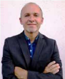
Text und Fotos: Lothar Mayer