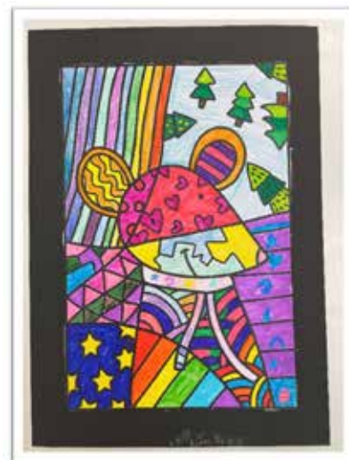
"Winter-Popart" der 1./2. Klasse ...