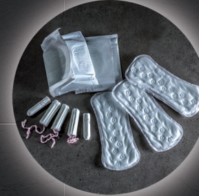
Tampons und Binden