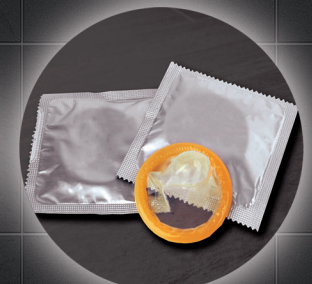
Kondome und vieles mehr ...