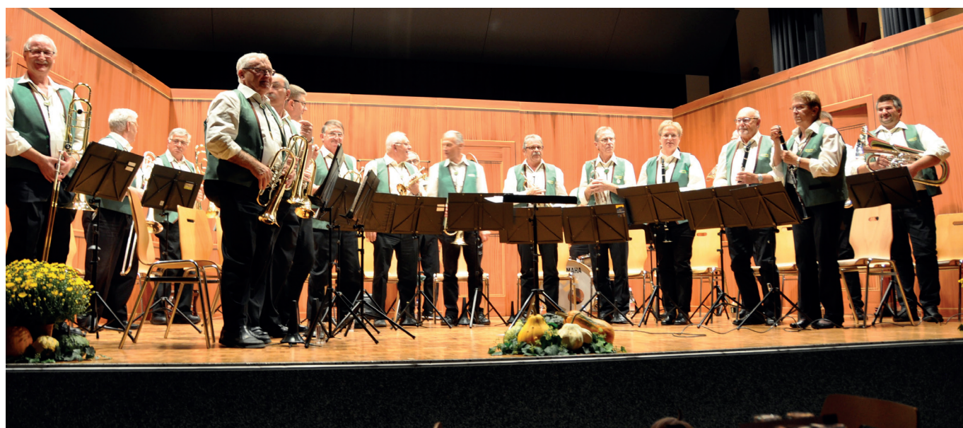
Das gelungene Konzert

Eine reichhaltige Tombola mit leckeren, vornehmlich landwirtschaftlichen Produkten fand reissenden Absatz. Nach deren Verlosung über das Glücksrad war der tolle Abend mit seinen Darbietungen um 23.30 Uhr zu Ende. Mit dem Erlebten über einen unvergesslichen Blasmusikabend nahmen unsere Konzertbesucher den Heimweg unter die Füße. Die Schiltwalder Blaskapelle dankt allen Konzertbesuchern für den sehr geschätzten Besuch und den spontanen Applaus. Wir hoffen auf ein baldiges Wiedersehen.