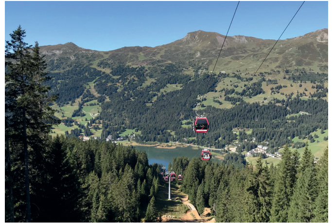
Bergbahn auf den Brambrüesch

Am Samstag wartete der Gipfel des Parpaner Rothorn auf uns, wo uns das schöne weitsichtige Panorama für den Aufstieg belohnte.