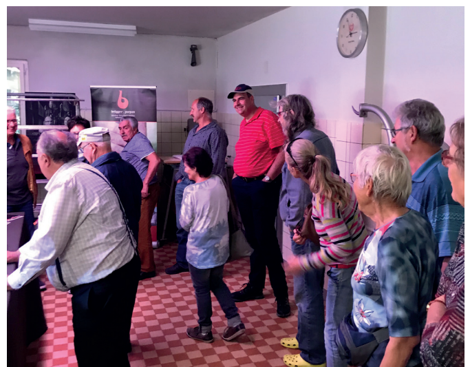
Fleischrocknerei in Parpan