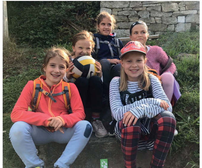
Auf Spurensuche beim Foxtrail

Mit vollgepackten Rucksäcken starteten wir am 22. September 2019 mit einer Gruppe aufgestellter Mädchen unsere Reise. Mit Bus und Zug reisten wir nach Lenzburg. Dort angekommen nahmen wir die Fährte des Fuchses vom Foxtrail auf. Mit viel Spass und Enthusiasmus wurden die Hinweise gesucht und die Rätsel gelöst. Der Fuchs führte uns hinauf zum Schloss Lenzburg. Nachdem wir gegen 13.00 Uhr den Foxtrail erfolgreich abgeschlossen hatten, genoss die Gruppe das wohlverdiente Mittagessen. Nachdem die Würste grilliert und gegessen waren, rundeten wir den gelungenen Tag mit ein paar Spielen ab. Wir konnten einen tollen Tag geniessen und freuen uns auf die nächste spannende Reise.