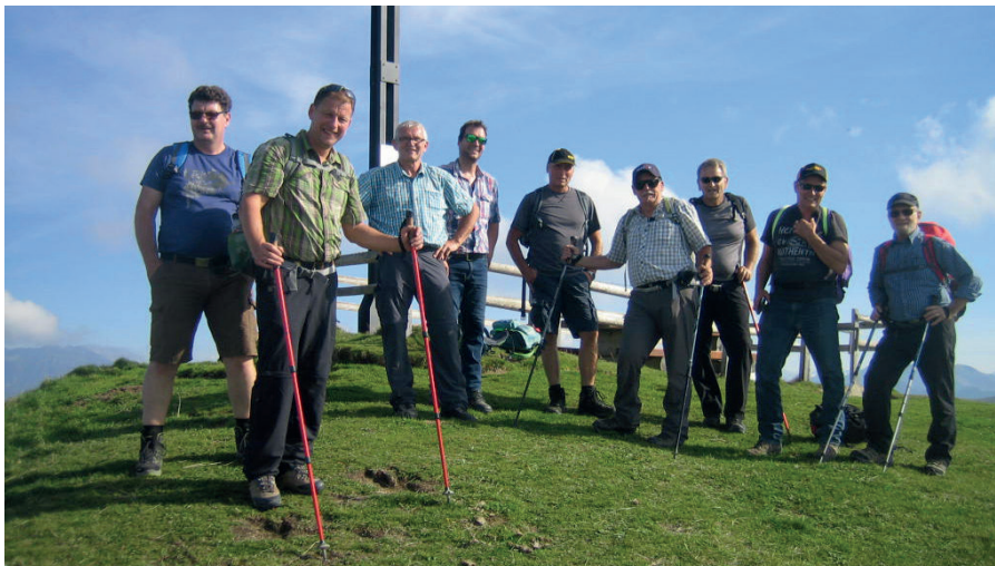
Sommet du Cousimbert

Im Anschluss erkundeten wir das Städtchen Gruyères. Nach einer ausgiebigen Besichtigung der Altstadt und einem sehr guten Mittagessen im Hotel de Ville Gruyères ging es in die bekannte Käserei «La Maison du Gruyères». In der Käserei durften wir unser Fachwissen rund um die Käseherstellung unter fachkundiger Leitung vertiefen. Im Verlaufe des späteren Nachmittages fuhren wir ein bisschen müde, jedoch voller schöner Eindrücke, zurück ins «Vallée de Rued».