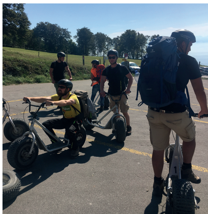
Mit dem Monstertrotti ging es bergab.