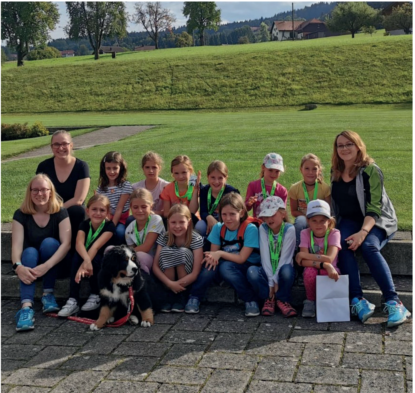
Die kleinen Jugimädels und ihre Leiterinnen