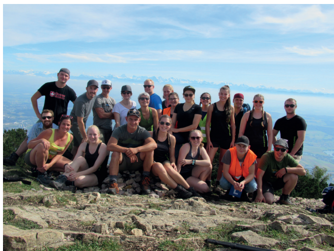
Gruppenfoto auf der Hasenmatt

Am Samstagmorgen, 14. September 2019, um 6.00 Uhr, besammelte sich die 22-köpfige Truppe im Schulhaus Walde, um eine kleine Reise zu machen. Zuerst ging es mit dem Zug nach Solothurn, wo wir die Adventure Rooms besuchten. Es wurde viel getüftelt und gerätselt, um in einer halben Stunde aus den verschlossenen Räumen zu fliehen. Nachdem sich alle wieder aus den Räumen befreit hatten oder vom Personal befreit wurden, ging es weiter mit Zug und Bergbahn auf den Weissenstein, wo wir eine 4-stündige Wanderung vor uns hatten.