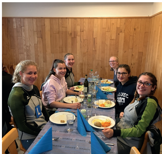
Zum Znacht gab es ein feines Raclette.