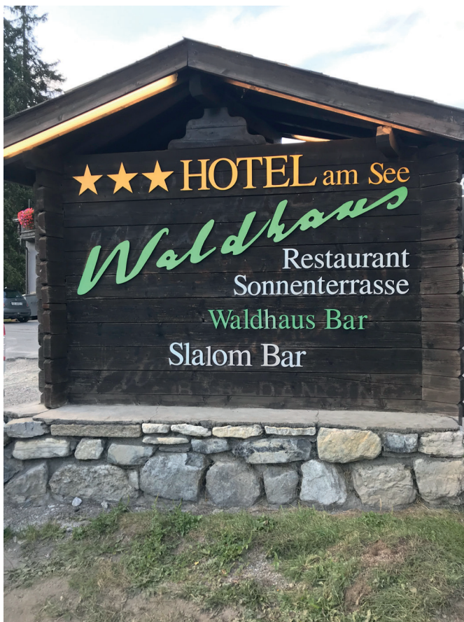
Hotel Waldhaus am See