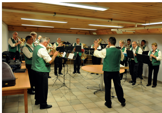
Die Schiltwalder Blaskapelle während einer Probe