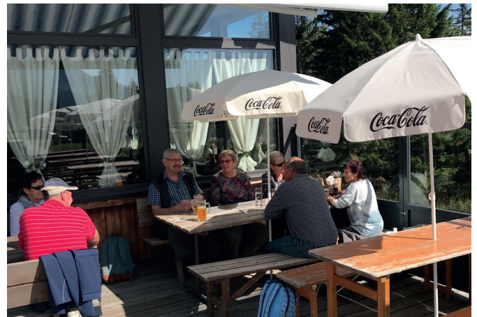
Pause bei einem kühlen Bier

Einige von uns erkundeten das Dorf Lenzerheide und den Heidsee, bevor es schon wieder Richtung Unterland ging. Nach einer kurzen Kaffeepause in Einsiedeln ging die Reise mit einem Znacht im Schmitte-Beizli zu Ende.