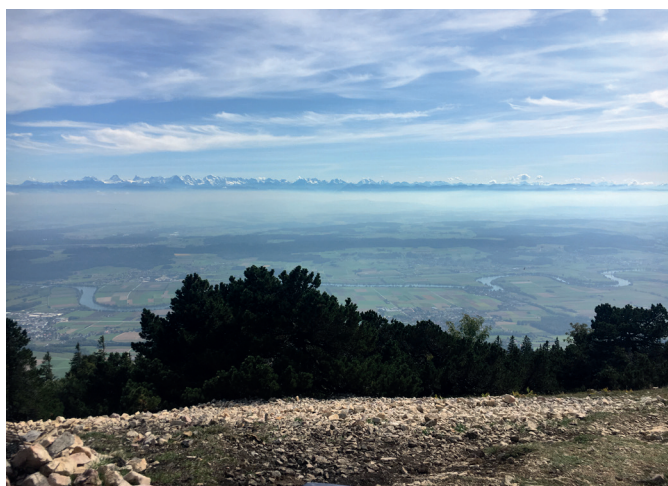
Super Aussicht vom Gipfel

Das Wetter meinte es gut mit uns und wir hatten vom Gipfel der Hasenmatt eine super Aussicht zur Eigernordwand, Titlis und der restlichen Alpenkette. Mit diversen Zwischenstopps sind wir am späten Nachmittag in unserer Unterkunft auf dem Obergrenchenberg angekommen.